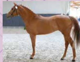
HYELLOW BOY LISON