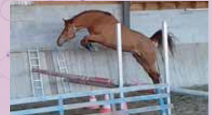
HYELLOW BOY LISON

HYELLOW BOY TIRE PROFIT DU MEILLEUR DE CHACUN DE SES ASCENDANTS. C'EST UN CHEVAL « TRÈS CHIC » (17/20 À LA FINALE) AVEC BEAUCOUP DE PRÉSENCE. IL BÉNÉFICIE D'UN EXCELLENT MODÈLE ET D'UNE TRÈS BONNE LOCOMOTION. APPLIQUÉ SUR LES BARRES, SON ÉQUILIBRE, SON RESPECT ET SA FORCE LUI CONFÈRENT UNE TRÈS BONNE TECHNIQUE DE SAUT. ENFIN ALLIANT SOUPLESSE, SANG ET RÉACTIVITÉ, HYELLOW BOY REPRÉSENTE RÉSOLUMENT LE CHEVAL DE SPORT MODERNE RECHERCHÉ AUJOURD'HUI.