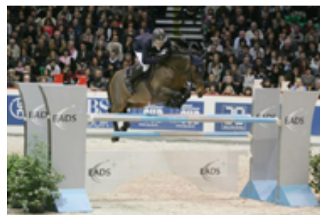
NINIO AU CSIW-BORDEAUX

SA MÈRE ROXANE DE GRUCHY ( + DE 650 000€ DE GAINS) FUT TRÈS GRANDE GAGNANTE ISO 189, JO DE BARCELONE (1992) ET D'ATLANTA AVEC PATRICE DELAVEAU (1996)